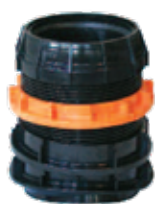
Easy Clip \varnothing 160 mm

Waterdichtheid, en onderdruk dichtheidstest gecertificeerd door DiBt