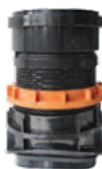
Easy Clip \varnothing 200 mm